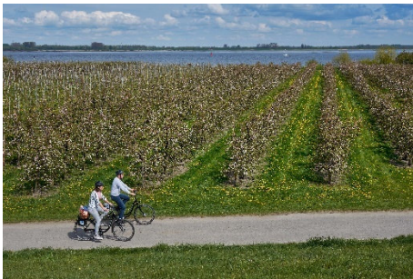
Radfahrer an der Elbe zur Apfelblüte im Alten Land

Fotos, die in Verbindung mit dieser Pressemitteilung unter Angabe des Fotografen genutzt werden dürfen: