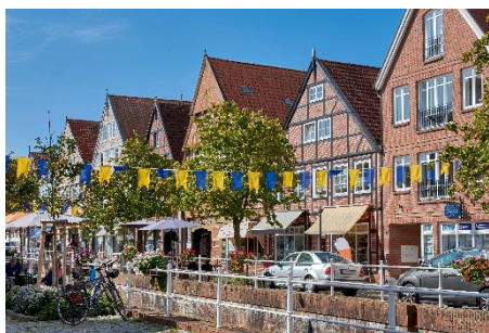
Die Märchen- und Hansestadt Buxtehude