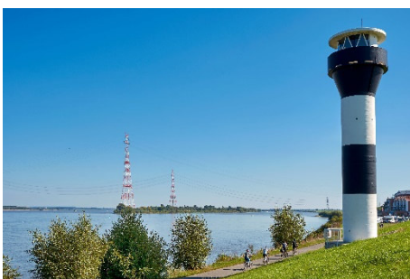
Radfahren am Twielenflether Leuchtturm entlang der Elbe