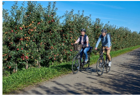
Radfahren zur Erntezeit im Alten Land