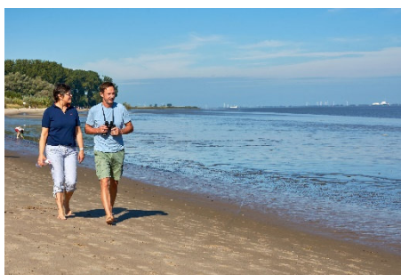
Spazieren am Strand von Krautsand