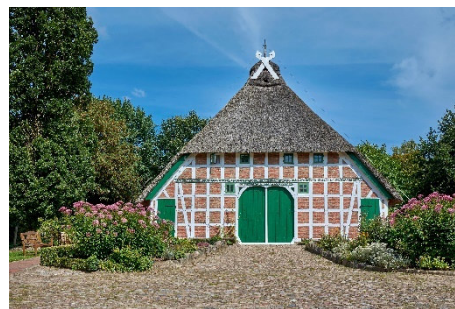
Beekhoff in Beckdorf