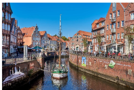
Die maritime Hansestadt Stade