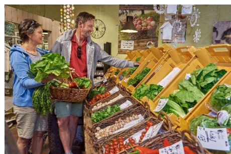
Hofladen Cohrs in Bliedersdorf