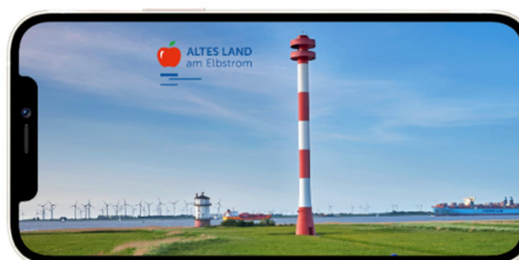
Neue App „Altes Land am Elbstrom“